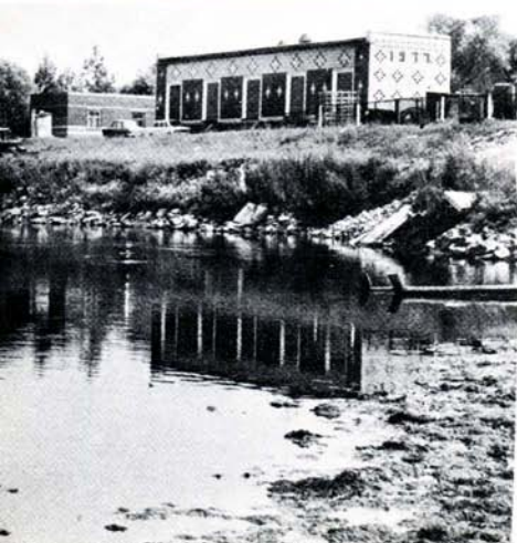
Озеро Лиман. Змиевская ГРЭС